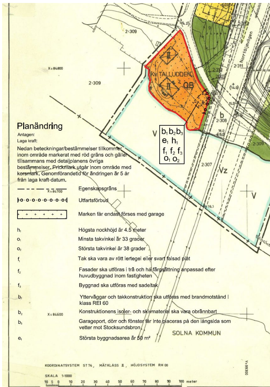
Figur 3: Urklipp ur detaljplan S411- ändringsområdet